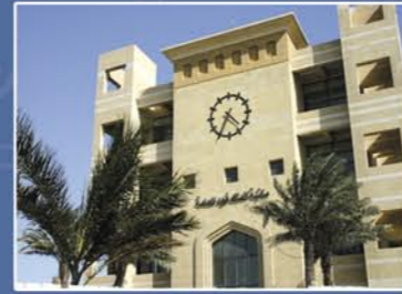
إجمالي المبالغ المعتمدة للكراسي العلمية